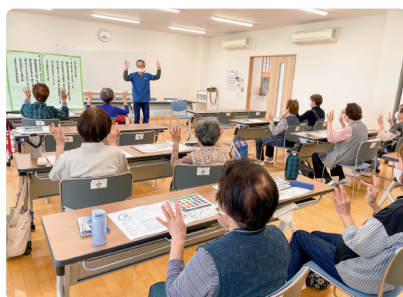
令和7年度はつらつ講座