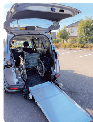
車いす・リフト車の貸出