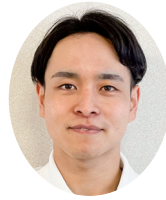
堂前 壘 (包括支援課)