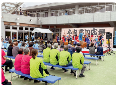
第42回吉田町ふれあい広場