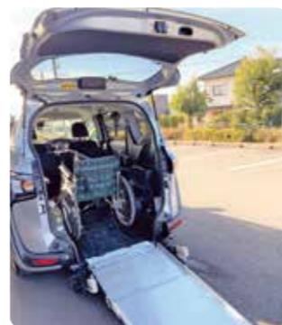
車いす・リフト車の貸出

★令和4年度『赤い羽根共同募金』から2,074,242円をいただきました。配分金は令和5年度事業に活用させていただきます。