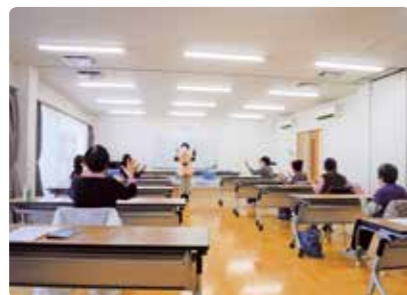
令和4年度はつらつ講座