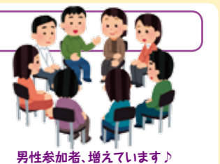
男性参加者、増えています♪

同じ悩みや経験をもつ介護者同士で、交流を深めませんか？ 日時：令和5年6月13日（火）午後1:30～3:00 場所：吉田町健康福祉センターはあとふる 2階研修室 対象者：町内在住の在宅介護者 申込み：参加希望の方は、事前に下記までご連絡ください。