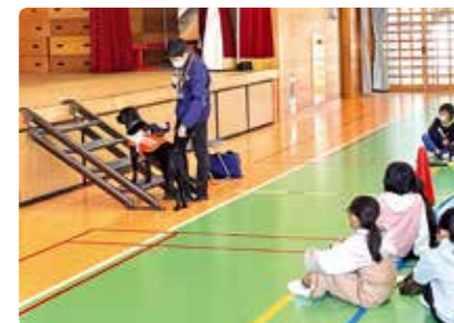
福祉体験（盲導犬教室）